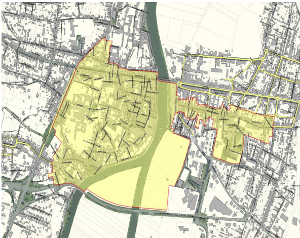
Ancien secteur sauvegardé