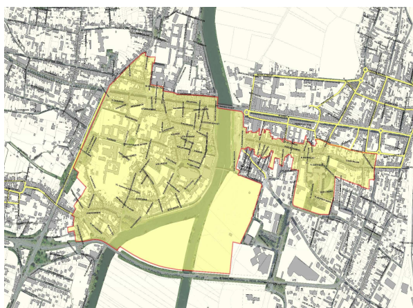
Ancien secteur sauvegardé