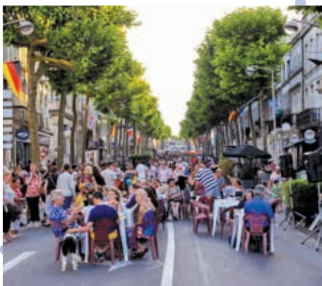
Depuis 37 ans, le 21 juin fête la musique dans les rues des villes et des villages dans la France entière.

▶ Le 21 juin, partout dans les rues de Saintes, la musique sera la reine de la soirée. Musiciens, amateurs ou plus confirmés, tous auront à cœur comme chaque année d'animer le centre-ville dans un esprit festif, convivial et familial. Et la fête se poursuivra aussi le 22 juin !