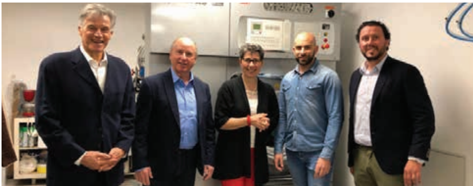
Visite du nouveau pressing «Espace Pressing Services» en présence du Maire, lundi 13 mai.

► Après six mois de travaux, l'Espace Pressing Services situé rue de l'Arc de Triomphe à Saintes retrouve des locaux entièrement rénovés, et s'inscrit dans une démarche éco-responsable, avec des équipements innovants dont seuls deux pressings disposent dans toute la région Nouvelle-Aquitaine.