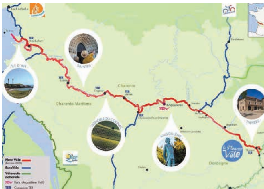
L'itinéraire de la Flow Vélo® longe la Charente et est reconnu à l'échelle européenne.

L'Abbaye aux Dames a lancé en 2016 Musicaventure, une expérience sensorielle et connectée grâce aux nouvelles technologies. L'aventure s'est enrichie en 2018 avec le Carrousel Musical «Bazilik» . Petits et grands entrent sous l'immense coque de miroir et de lumière pour embarquer à bord d'un manège unique et magique. Face aux