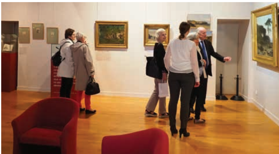
Le lancement officiel de l'exposition s'est déroulée au musée de l'Échevinage le 18 mai dernier.

► La Ville de Saintes et l'Institut Gustave Courbet s'associent cette année pour fêter le bicentenaire de la naissance du célèbre peintre du XIX e siècle. Le musée de l'Échevinage présente ainsi de nombreuses œuvres du maître du 18 mai au 31 octobre à travers une exposition exceptionnelle.