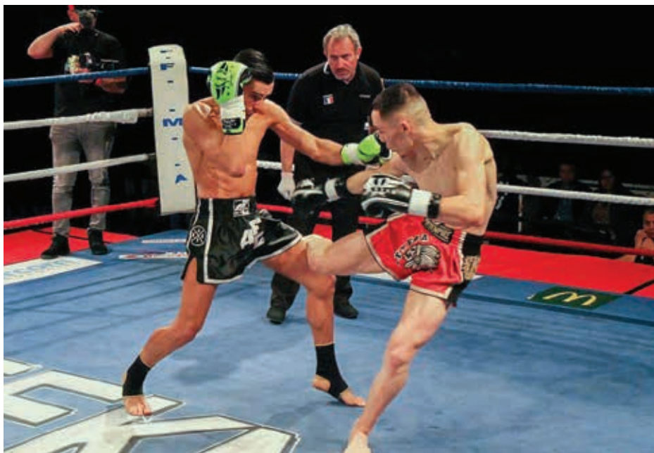
La Nuit de l'Impact, événement national organisé par la club, est désormais retransmis à la télévision.

► Le club saintais d'arts martiaux ne cesse de prendre de l'ampleur et sa réputation dépasse désormais largement les frontières. Récompense du travail sérieux réalisé : les titres se multiplient au plus haut niveau !