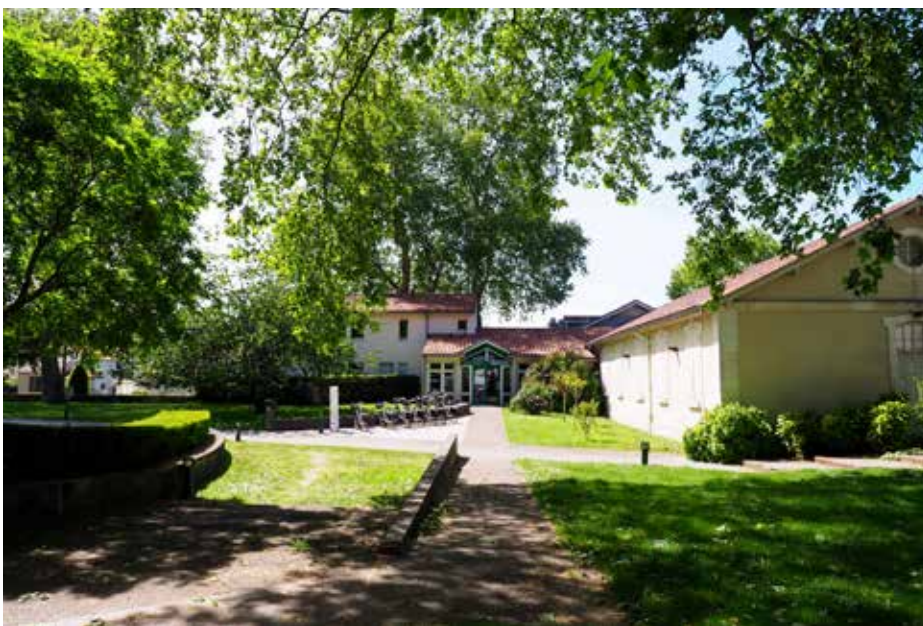
L'Auberge de Jeunesse de Saintes est située tout près de l'Abbaye aux Dames.

▶ Dans un cadre verdoyant en plein cœur de la ville, l'Auberge de Jeunesse de Saintes accueille tous les publics, individuels ou en groupe, pour des séjours plus ou moins longs, avec une haute qualité d'hébergement et de services.