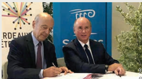
SIGNATURE DU PROTOCOLE DE COOPÉRATION SAINTES-BORDEAUX 2018-2020 JEUDI 11 OCTOBRE 2018