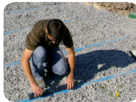
Contrôle de bonne exécution