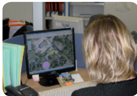
Contrôle de conception

Comment ? Vérification de l'installation avant recouvrement par la terre végétale (implantation du dispositif, dimensions et qualité des matériaux mis en œuvre).