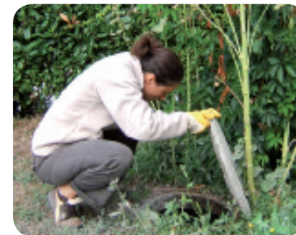
Contrôle de fonctionnement d'un dispositif d'assainissement individuel

Comment ? Vérification de l'état des ouvrages, de la ventilation, de l'accessibilité, de l'écoulement des effluents, et de l'entretien des ouvrages.