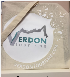
Sac en coton avec anses 38x42 cm