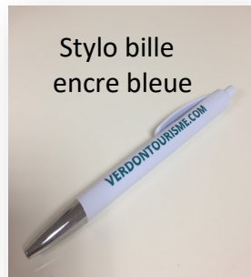
Stylo bille encre bleue