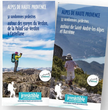
Autour de St-André-les-Alpes et Barrême / Autour des Gorges du Verdon, de la Palud-sur-Verdon à Castellane Lot de 2 cartes - 69 randonnées