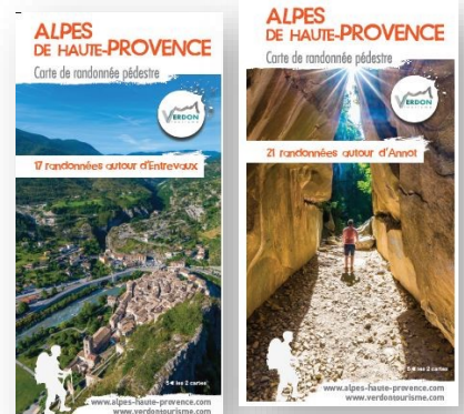
Autour d'Annot / Autour d'Entrevaux Lot de 2 cartes - 38 randonnées