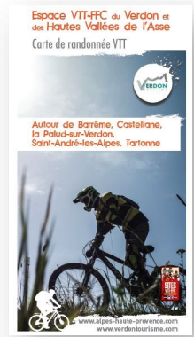
Autour de Barrême, Castellane, La Palud-sur-Verdon, St-André-les-Alpes 24 itinéraires