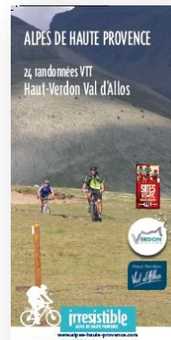
Autour du Haut-Verdon Val d'Allos 24 itinéraires