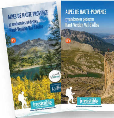
Haut-Verdon / Val d'Allos Lot de 2 cartes - 54 randonnées