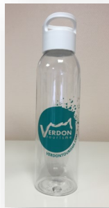
Bouteille 650 ml sans BPA, durable et réutilisable