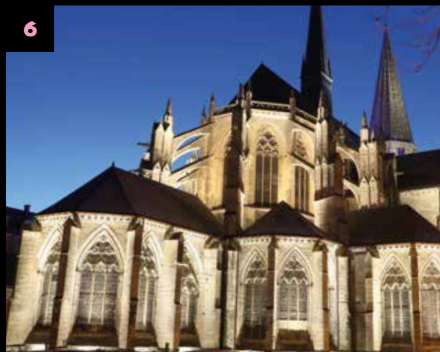
Chevet de la Trinité

Réponse du jeu : 7 dragons, à savoir 1 sur l'hôtel du Saillant, 1 sur chapelle st-Jacques, 2 près du pont Chartrain, 1 près de la passerelle en bois Édouard Massé, 1 près de la passerelle Jean Monnet, 1 rue Geoffroy Martel