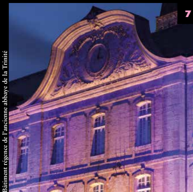
Bâtiment régence de l'ancienne abbaye de la Trinité