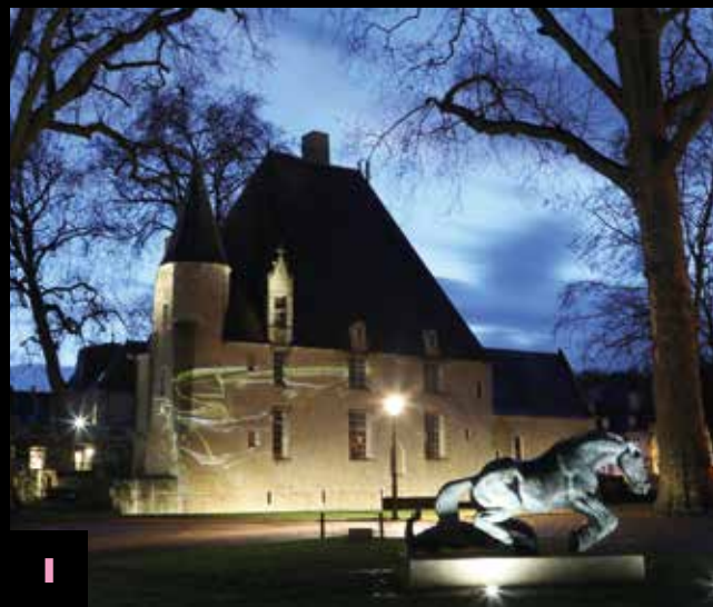
Hôtel du Saillant – Office du tourisme

Réponse du jeu : 7 dragons, à savoir 1 sur l'hôtel du Saillant, 1 sur chapelle st-Jacques, 2 près du pont Chartrain, 1 près de la passerelle en bois Édouard Massé, 1 près de la passerelle Jean Monnet, 1 rue Geoffroy Martel