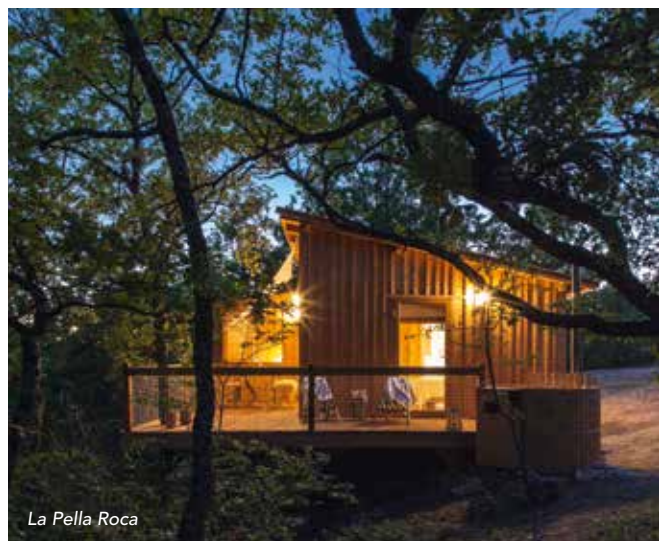
La Pella Roca

Pella Roca, cabane & Spa en Quercy, un domaine truffier de charme qui vous propose toute l'année deux cabanes perchées, (et bientôt une troisième, notre cabane Tropicabana) dans lesquelles règne une ambiance à la fois accueillante et dépayssante, chaleureuse et intemporelle. Vue imprenable sur les coteaux du Quercy et spa privatif dans chaque cabane.