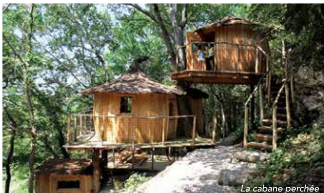
La cabane perchée

Tout a été longuement pensé, réfléchi et fait avec amour. Après de longues heures de labeur, deux cabanes ont vu le jour du haut de leur perchoir et vous attendent pour des jours heureux !