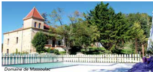
Domaine de Massoulac

Infos Pratiques Agencement : La salle de 600 M2 est chauffée ou climatisée selon la météo et vous avez une terrasse extérieure dallée de 700 m 2 sur l'ensemble des 3 côtés donnant sur le parc. La location comprend les tables rondes de 180 cm et les chaises type Napoléon III blanches pour 300 personnes. Possibilité de louer en même temps 5 villas pour 44 personnes.