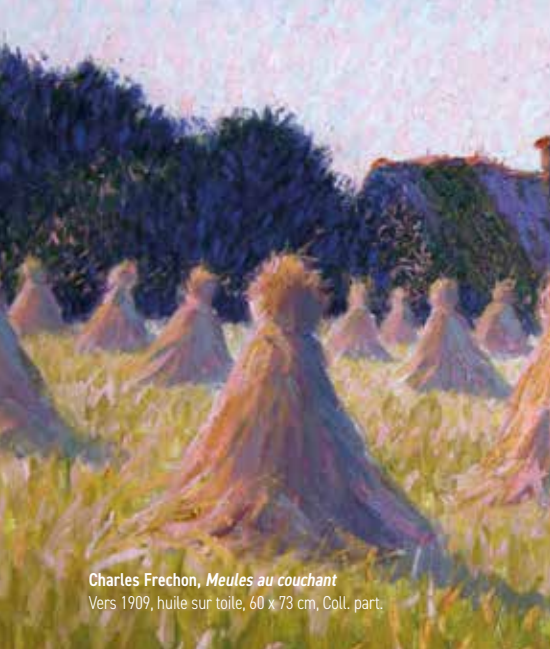
Charles Frechon, Meules au couchant Vers 1909, huile sur toile, 60 x 73 cm, Coll. part.