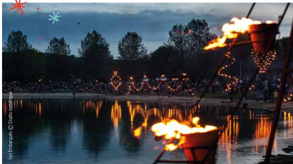
Les Embarqués