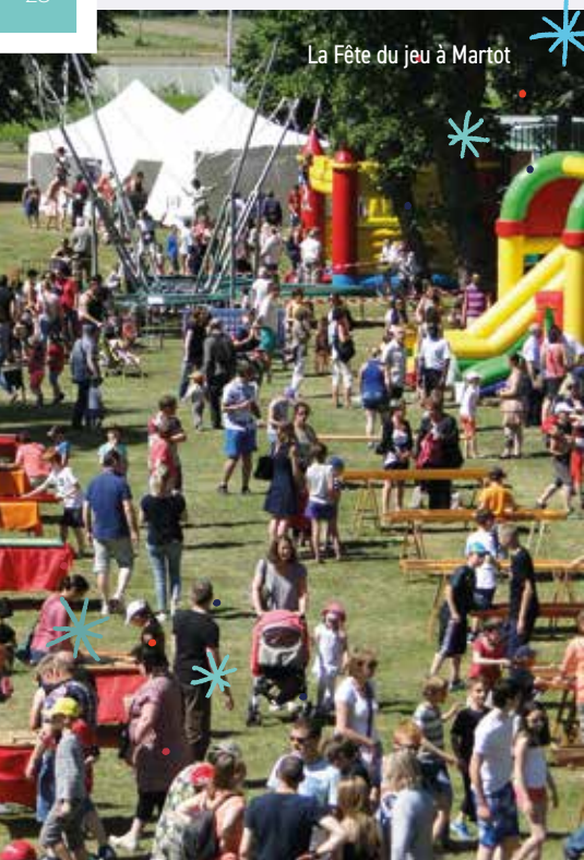
La Fête du jeu à Martot

Salle des fêtes, Place Paul Vaur ☎ 02 32 40 17 50