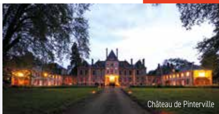
Château de Pinterville