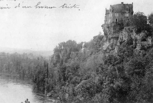
78. Dordogne - Environs de Sarlat - Château de Montfort