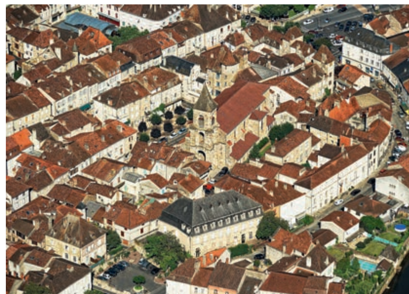
Saint-Céré vue du ciel

À la fin du XIX e siècle, Saint-Céré continua son essor commercial et artisanal. Aujourd'hui, le centre ville reste l'image d'un grand dynamisme avec plus de 100 commerces diversifiés qui, au travers de leur association, propose régulièrement des animations. Saint-Céré est aussi au cœur d'un territoire de projets qui s'identifie et s'ancre autour de savoir-faire liés aux métiers de l'industrie mécanique, en particulier dans les domaines de l'aéronautique, de l'automobile et de la machine outil : La Mécanic Vallée.