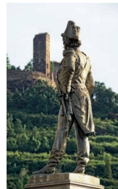
Statue Canrobert © D. Viet