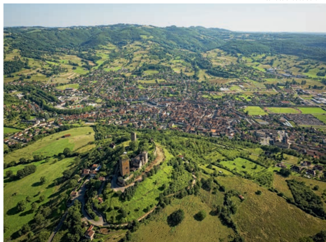
Saint-Céré vue du ciel