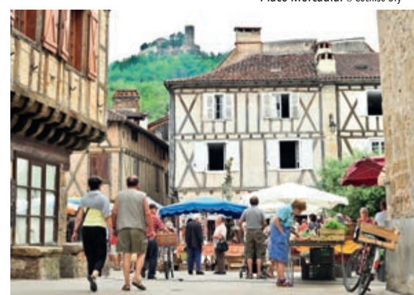
Place Mercadial