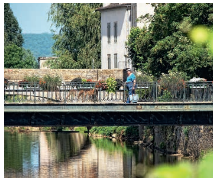
Le pont d'Hercule