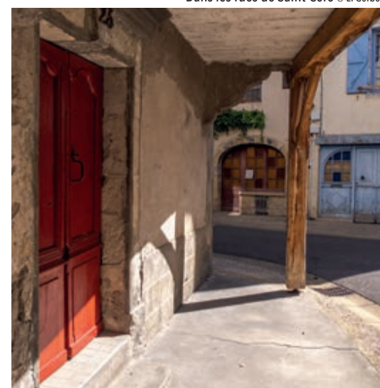
Dans les rues de Saint-Céré

Saint-Céré carried on prospering throughout the 19 th century. Today the lively city centre boasts over 100 shops as well as many events and artisan workshops. For many years, Saint-Céré has been at the heart of an economic hub specialised in car and aircraft industries.