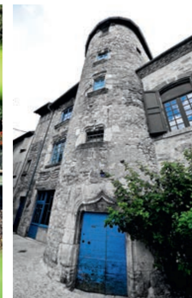
Hôtel Puylmule © Cochise Ory