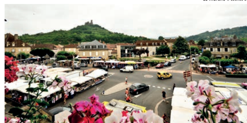
Le marché