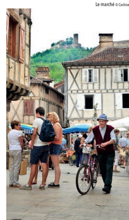
Le marché