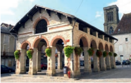
La Halle

2 Place du Four - Mairie Belle maison noble du XVI e siècle, devenue mairie en 1991. Au Moyen-Age se situait ici le four banal (ou four communal) de Gramat. Beautiful 16th century mansion that became the