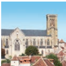
Eglise St-Pierre

En longeant à gauche de l'église, vos pourrez admirer les jolis jardins en terrasse et, au loin, l'imposant édifice du couvent des Sœurs Notre-Dame du Calvaire. Puis descendez la Rue Joviale, ruelle étroite et pentue qui fut longtemps la voie d'entrée principale de Gramat.