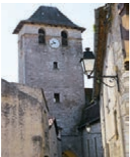
Tour de l'Horloge

la tour fut transformée en beffroi en 1561. La cloche servait à alerter la population en cas de danger ou pour célébrer les fêtes. Originally just an entrance to the medieval fort, the clock tower was converted into a belfry in 1561. The bell was used to warn the population against danger or during celebrations.