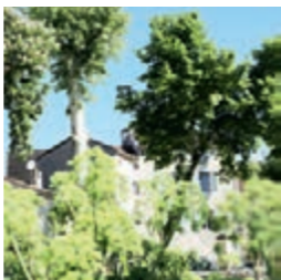
Les jardins de la Mairie

city Town Hall in 1991. In the Middle-Ages the communal oven was situated here.