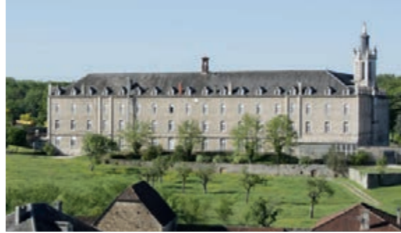
Le Couvent

A bit of history Gramat and its surroundings have been inhabited for several millennia as proven by the discovery of the "Man de Gramat" skeleton dated from the Mesolithic period. Later in the Celtic period, many burial mounds (tumuli) were built in the area. From the 11th to the 13th century, the barons of Castelnau constructed their first fortified castle at the highest point of the city, today called the square 'François Mitterrand'. As pilgrimage to Rocamadour developed in the 12th century, Gramat grew to become a prosperous city and was granted right to organise fairs and markets in 1224. The Hundred Years' War, followed by the plunders and the plague of 1348, almost entirely destroyed Gramat. Only five families survived. The city was then repopulated by immigrants from neighbouring regions such as Auvergne, Rouergue and Limousin. 5km from Gramat, the church Saint-Aignan in the hamlet of Saint-Chignes was part of a priory destroyed during the Hundred Years' War. It was later rebuilt to become the parish church. Its various periods of construction and modification spread from