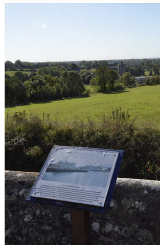
Vue sur la vallée de la Sienne

Autour de l'église se dresse un promontoire avec une vue sur la vallée de la Sienne. On y retrouve quelques panneaux évoquant l'histoire de la commune de Hyenville. D'anciennes cartes postales permettent de visualiser les lieux tels qu'ils étaient autrefois et ainsi de découvrir l'importance du patrimoine historique et industriel de la commune. Hyenville connut une activité intense quand la gare, le moulin, la distillerie et les fours à chaux fonctionnaient.