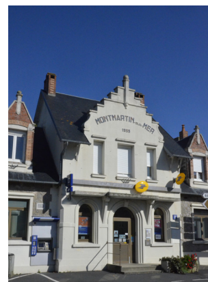
La poste de Montmartin-sur-Mer

Datant de 1933, son style balnéaire régionaliste est surprenant. Elle comprend un pavillon central et des pavillons latéraux plus bas. Ce bâtiment à deux niveaux possède un fronton traité comme un pignon flamand avec des emmarchements et des consoles à volutes au centre (sorte de courte colonne portant une boule). L'édifice est labellisé « Patrimoine du XX e siècle ».