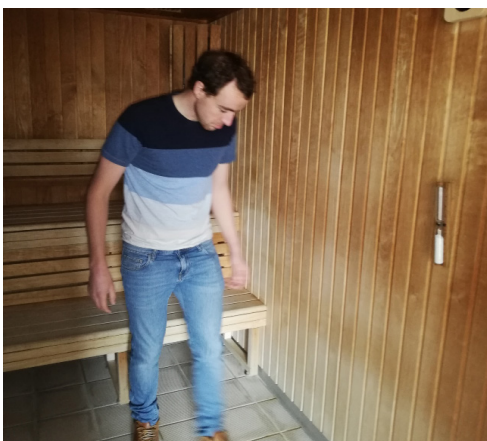
Le directeur du centre aquatique effectue des visites de contrôle fréquentes

société Dalkia et les services de la Communauté de Communes effectuent des visites de contrôle afin que l'établissement soit prêt lorsqu'il sera autorisé à rouvrir ses portes. La température des bassins et des espaces a été ramenée à 20 degrés pour limiter les charges financières énergétiques ; Sur sa page facebook, le centre aquatique dispense régulièrement de précieux conseils pour se maintenir en forme durant la période de confinement.