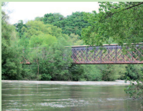
Le pont de Castagnède sur le Gave d'Oloron

C e pont de type Eiffel a été édifié en 1884 dans le cadre de la construction de la ligne ferrovière Puyoò - Salies - Mauléon.