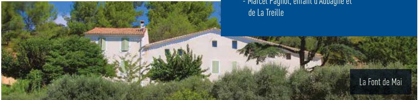
La Font de Mai