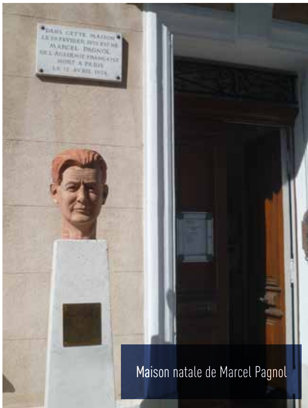
Maison natale de Marcel Pagnol

Elu à l'Académie Française en 1946, Marcel Pagnol reprend la caméra pour tourner La Belle Meunière (1948) en couleur, Manon des Sources (1952) et Les Trois Lettres de mon Moulin (1954) d'après Alphonse Daudet.