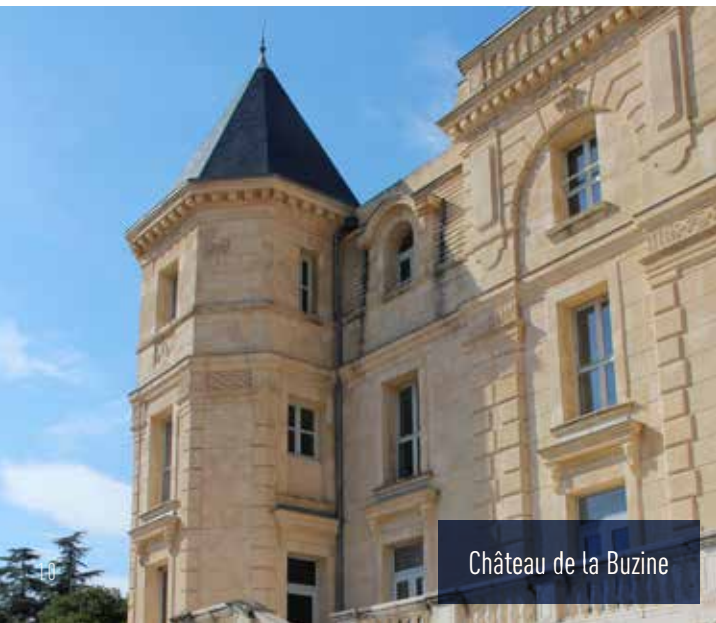
Château de la Buzine